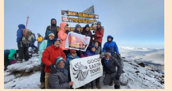
The Picture is taken at the Summit of Mount Kilimanjaro at 19341ft above sea level.