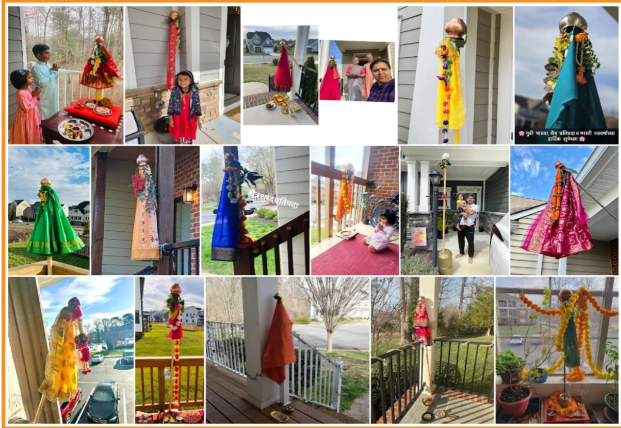
Richmond Gudi Padwa 2023 – Photos of Gudis shared by our GRMM Community